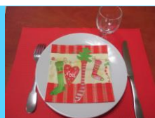
Tables de Noël