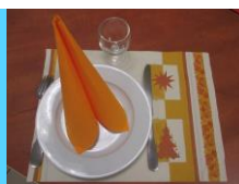
du Jour de l'An